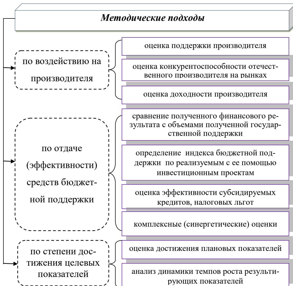
Рисунок 3 – Классификация методических подходов к оценке эффективности государственного регулирования сельского хозяйства

Существующие в теории и практике методические подходы к анализу эффективности государственного регулирования сельского хозяйства можно классифицировать по следующим признакам (рисунок 3):