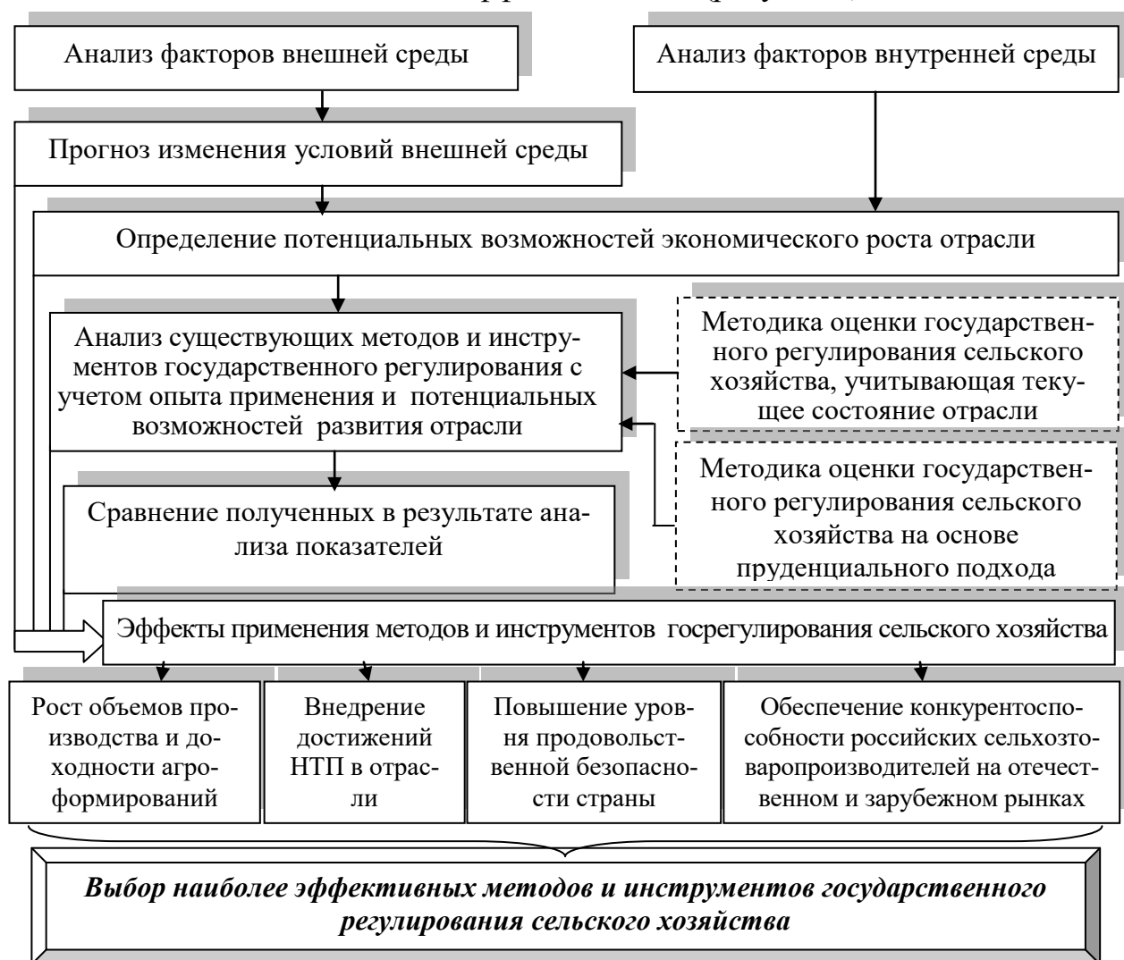
Рисунок 2 – Процесс выбора эффективных методов и инструментов государственного регулирования сельского хозяйства на основе пруденциального подхода

Таким образом, под системой государственного регулирования в сельском хозяйстве мы будем понимать совокупность направлений, методов и инструментов регулирования деятельности сельхозтоваропроизводителей, рыночного механизма отрасли, сформированных и реализуемых с учетом вызовов внешней среды и основанных на их прогнозировании. При этом выбор направлений, методов и инструментов государственного регулирования должен обуславливаться их экономической эффективностью (рисунок 2):