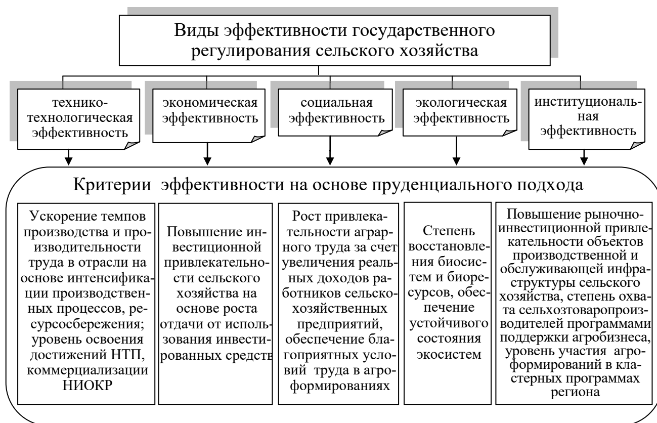
Рисунок 4 – Предлагаемая система критериев эффективности государственного регулирования сельского хозяйства

Считаем, что при установлении критериев эффективности государственного регулирования сельскохозяйственного производства в рассмотренных методических подходах не учтены степень стратегической обоснованности реализуемой аграрной политики и воздействие быстроизменяющихся факторов внешней среды. В этой связи применение пруденциального подхода потребовало использовать следующие критерии эффективности мер государственного регулирования (рисунок 4).