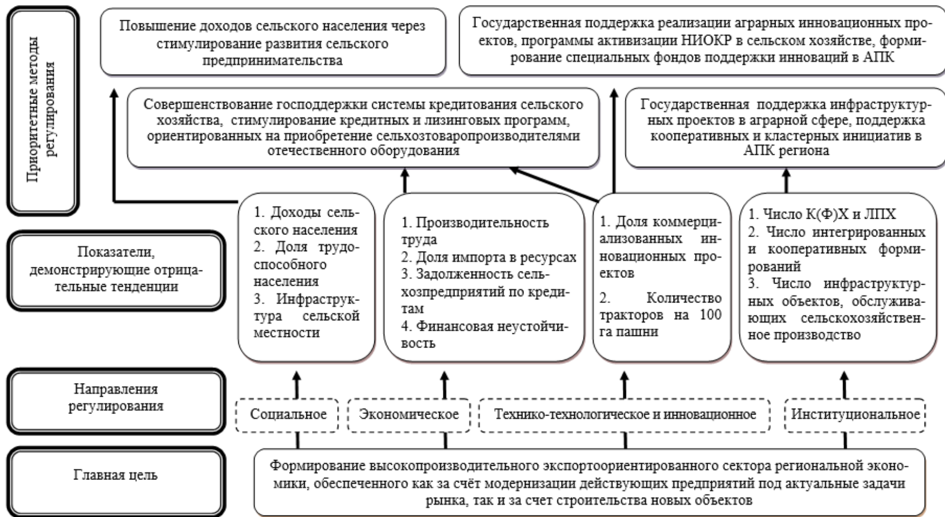
Рисунок 6 – Дерево решений развития системы государственного регулирования сельского хозяйства Пензенской области